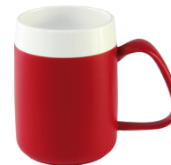
Beker met Trink-Trick