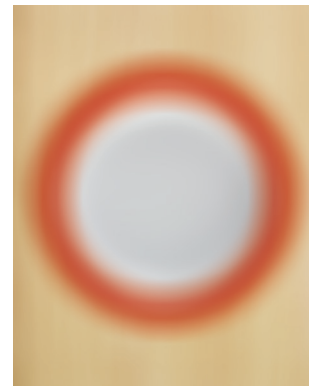
Wit bord met gekleurde rand