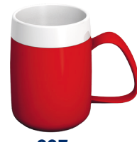
Beker met "Trink-Trick"