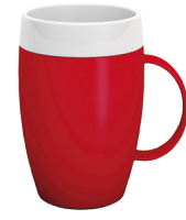
Beker met "Trink-Trick"